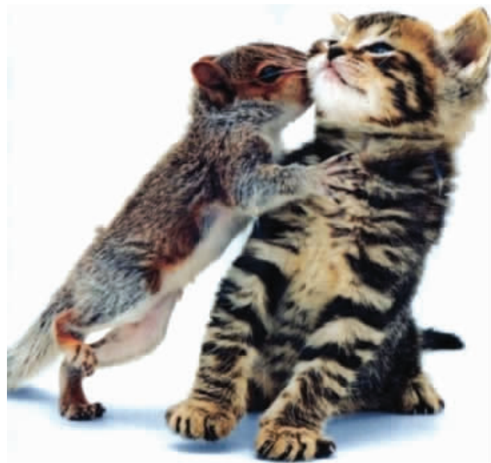
猫儿被外戚强吻了,这该如何是好?

越来越多的网友喜欢与宠物为伴,同时,用相机记录其各种美妙的瞬间,小宠物可爱、搞笑的一幕,被相机记录下来。于是,网络上就多了一些宠物的图,晒晒各家宠物的图已经成为时尚。