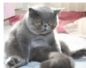
拿什么拯救你,我的肥猫