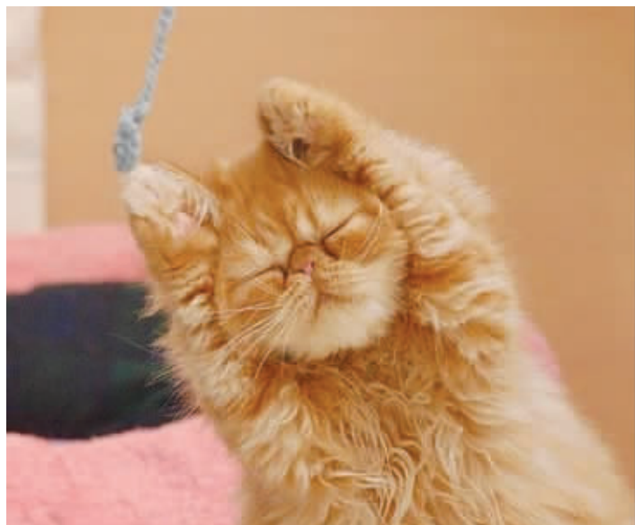
猫说:“其实,我是一只兔子。”