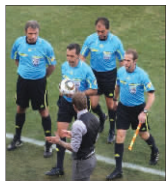
昏哨让小贝都愤怒了