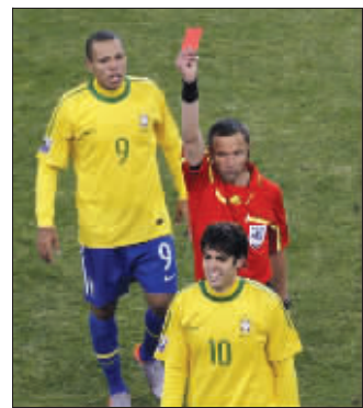
红牌一出,卡卡笑了,无语!