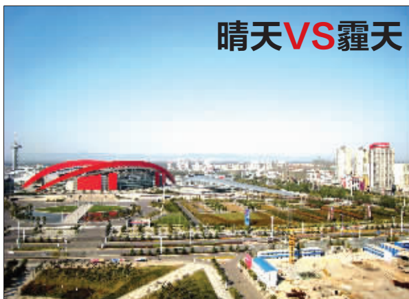
晴天,能看见远处的山

灰霾除了影响空气能见度,还对人体健康有损害。由于颗粒极小,能被人体吸入,易引起鼻炎、支气管炎等病症。同时,灰霾天气还导致近地层紫外线减弱,导致传染性病菌的活性增强,传染病增多。