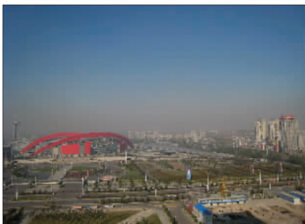
霾天,天空一片灰蒙蒙