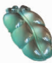
缘: 高冰种,通透晶莹。金枝玉叶(出自琢之缘)