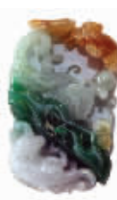
好光泽很强。自南华宝庆: 中水较欢喜如意挂件(出自南华)