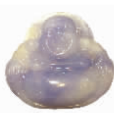
纯正的紫色,晶莹剔透。(出自南华宝庆): 浓艳冰清玉洁无量佛

收藏市场有“捡漏”一说,其意思就是以低廉的价格得到好的藏品。几乎每个藏友都做过捡漏的梦,然而,有专家表示,如今是个收藏盛世,早已不是捡漏的年代了。普通的收藏爱好者收藏喜欢的、力所能及的东西,但是真正有收藏价值的东西一定不会是便宜货。