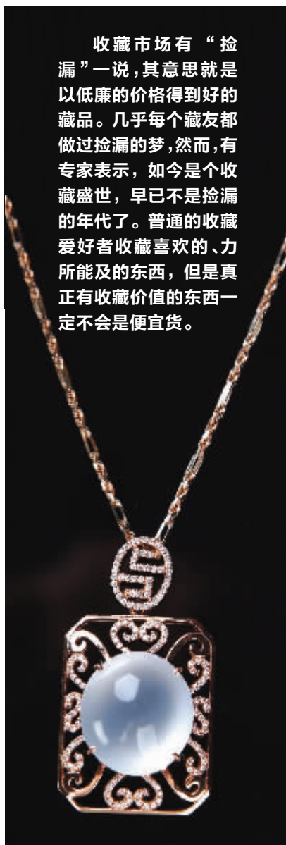
如意圆满 (出自润雅碧轩): 老坑荧光玻璃种镶钻吊坠

收藏市场有“捡漏”一说,其意思就是以低廉的价格得到好的藏品。几乎每个藏友都做过捡漏的梦,然而,有专家表示,如今是个收藏盛世,早已不是捡漏的年代了。普通的收藏爱好者收藏喜欢的、力所能及的东西,但是真正有收藏价值的东西一定不会是便宜货。