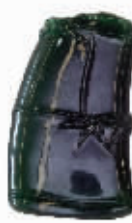
绿玻璃种质,重30.00克。南华宝庆: 帝王级老坑满竹节挂件(出自南华)