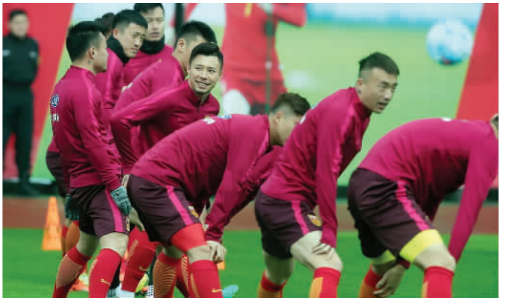
国足能创造奇迹吗?

昨天,国足在长沙贺龙体育场来了个大合影,教练、球员、工作人员一应俱全,里皮坐在第一排中间,自信满满。对阵韩国和伊朗的这两场比赛,或许就将决定国足最后的命运。