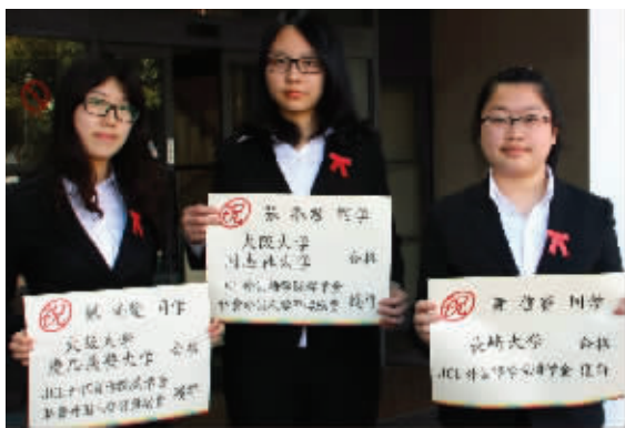
中日班学生考取世界名校并获得奖学金