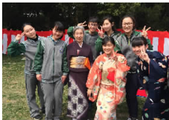
参加省人大举办的“中日友好樱花节”纪念活动