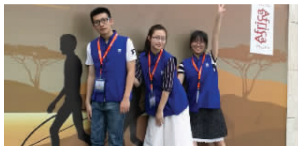
中日班南京博物院志愿者服务团队的部分成员