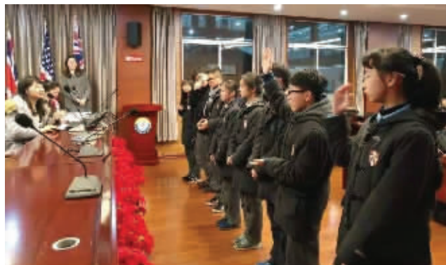
英语单词风暴竞赛

以素养教育为特色的东外国际部内,学生自我管理特色处处体现。“大多数学生实行住宿制。从早上起床到晚上睡觉前,从卫生、课堂纪律、作业、出勤到校服,学校都采取了精细化管理。以百分制为满分,学校常规活动管理落实到每一天、每一周、每一月。学生活动也是培养学生自主的重要途径,比如最近学校内举行的国歌比赛,一学期下来,学校前